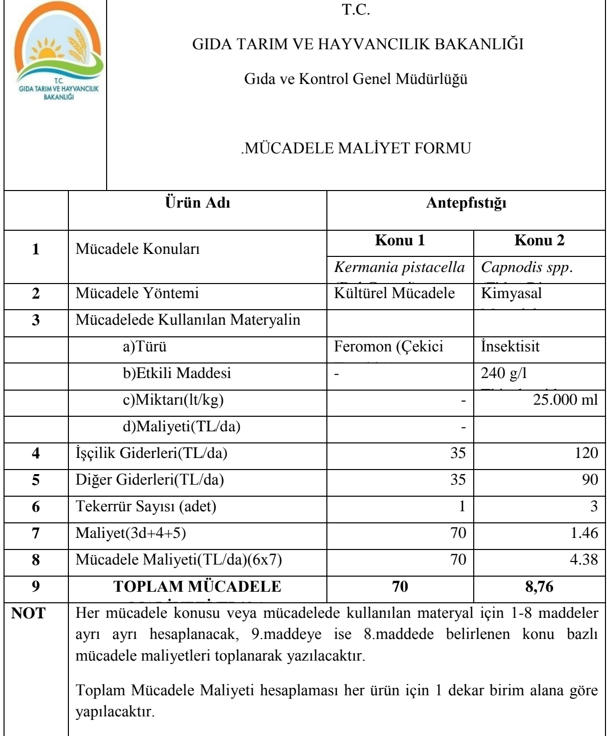
Tablo 28. Antepfıstığı Mücadele Maliyeti ( 2015 )